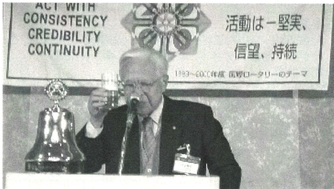
田辺パストガバナーの音頭で乾杯