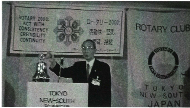
柴本ソングリーダーのリードで年の初めを全員で熱唱