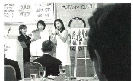
モデルの高須夫人にカラーコーディネート