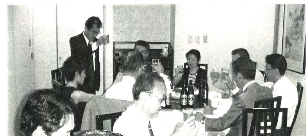
未来さんの元気な姿も見えます。現在中央大学総合政策学科2年生