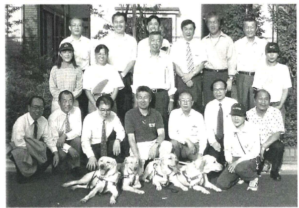
アイメイトと共に