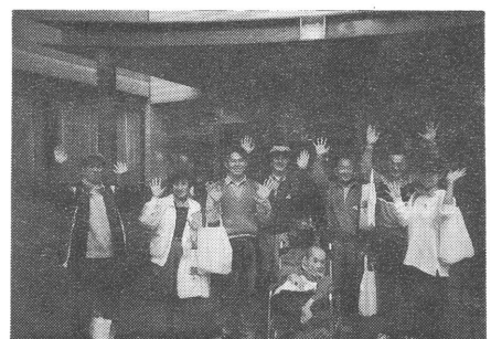
三田福祉会館にゴール