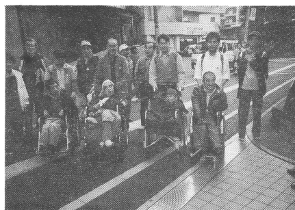
ゴールまであと少し